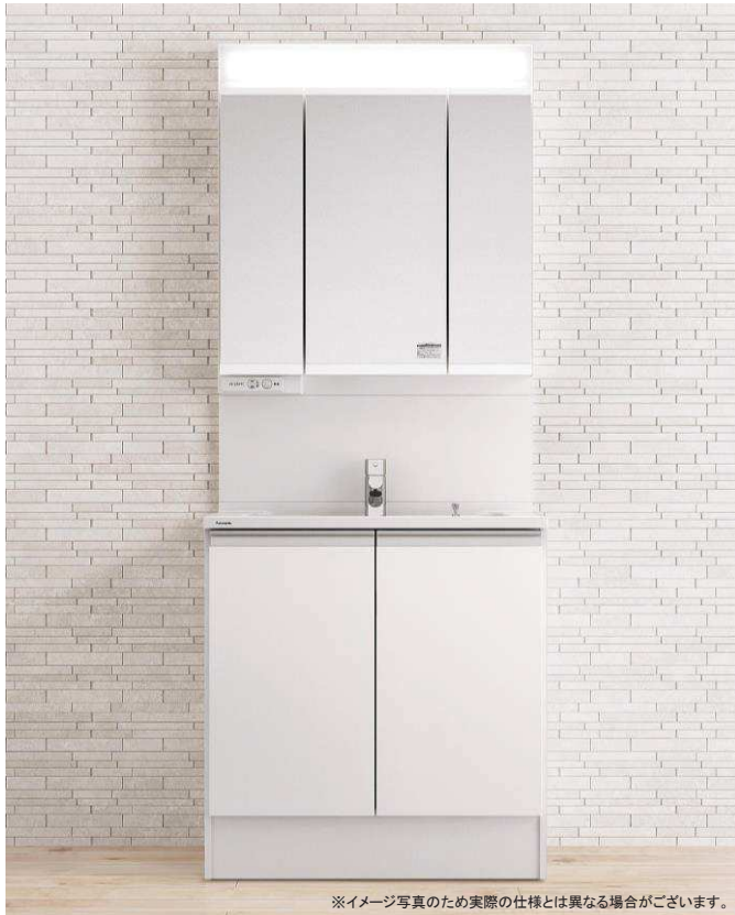
※イメージ写真のため実際の仕様とは異なる場合がございます。