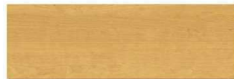
クリエラスク/L(チェリー柄)