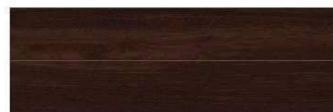
クリエダーク/D(ブラックウォールナット柄)