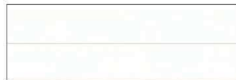
クリエホワイト/W(シダー柄)