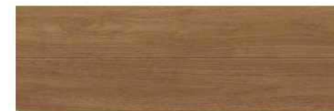
クリエモカ/M(ブラックウォールナット柄)