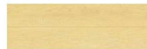
クリエペール/P(メープル柄)