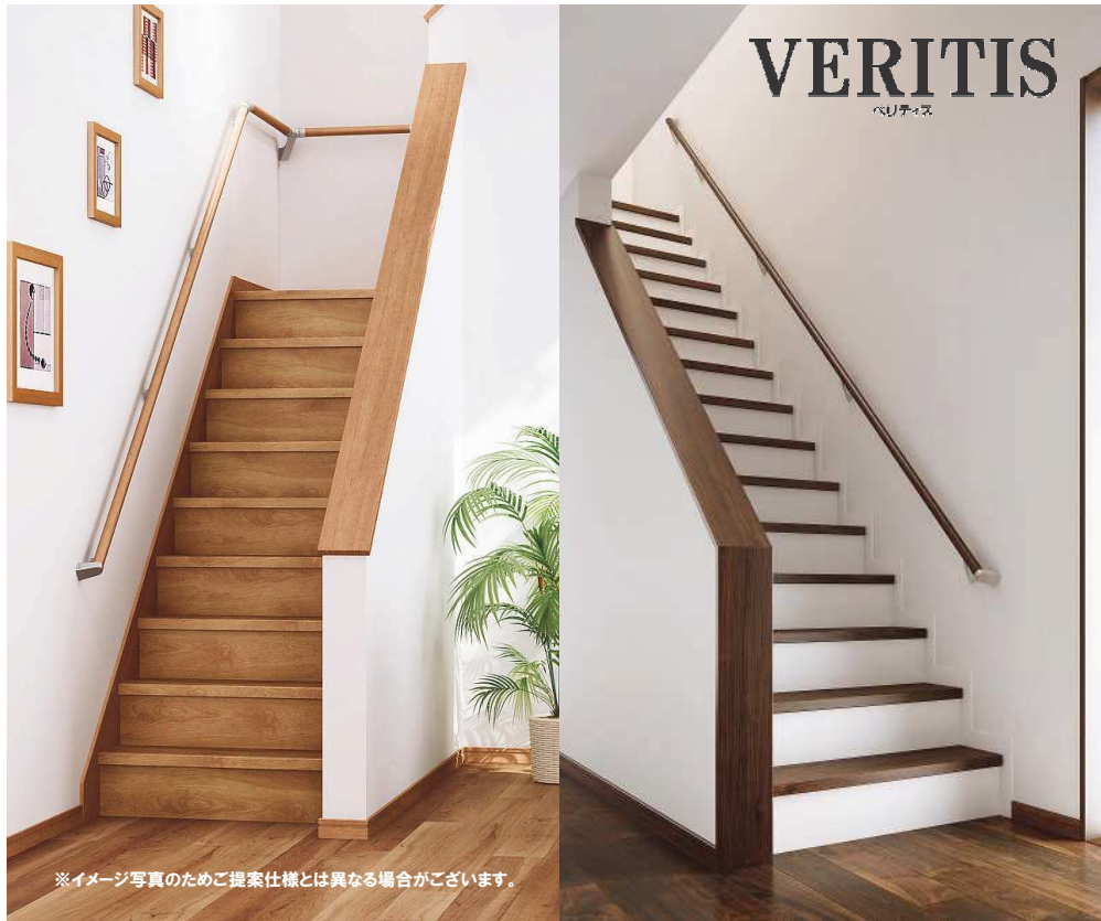
※イメージ写真のためご提案仕様とは異なる場合がございます。