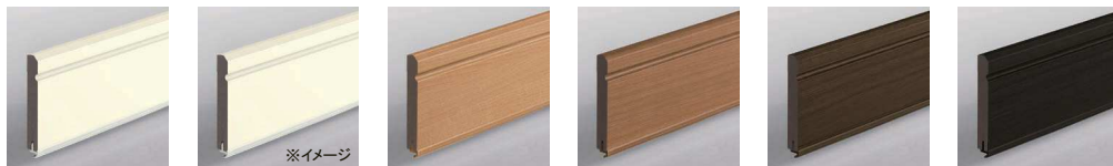
プレシャスホワイト