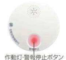
作動灯・警報停止ボタン

熱検知部の作動状態を約1時間に1回自動的に試験します。 ※機器異常発生時、警報停止ボタンを押せば、警報音は止まります。(約16時間停止) さらに、警報停止ボタンは作動灯を兼ねた照光スイッチ。大きく見やすいLED表示で火災発生や機器の異常をわかりやすくお知らせし、操作を促します。