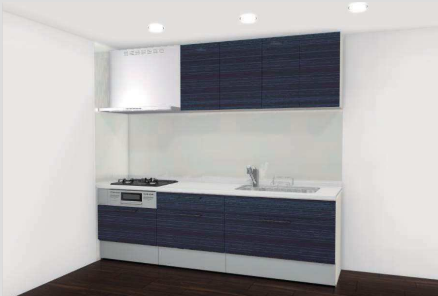
CG合成によるイメージ画像です。現場調成品、シリーズ外選定品に関しては表現していません。